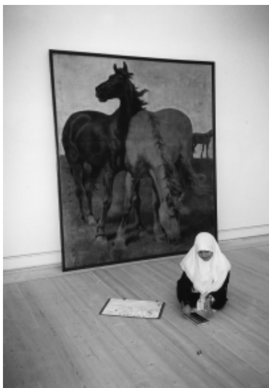
Fra udstillingen "Det ka' vi li' I